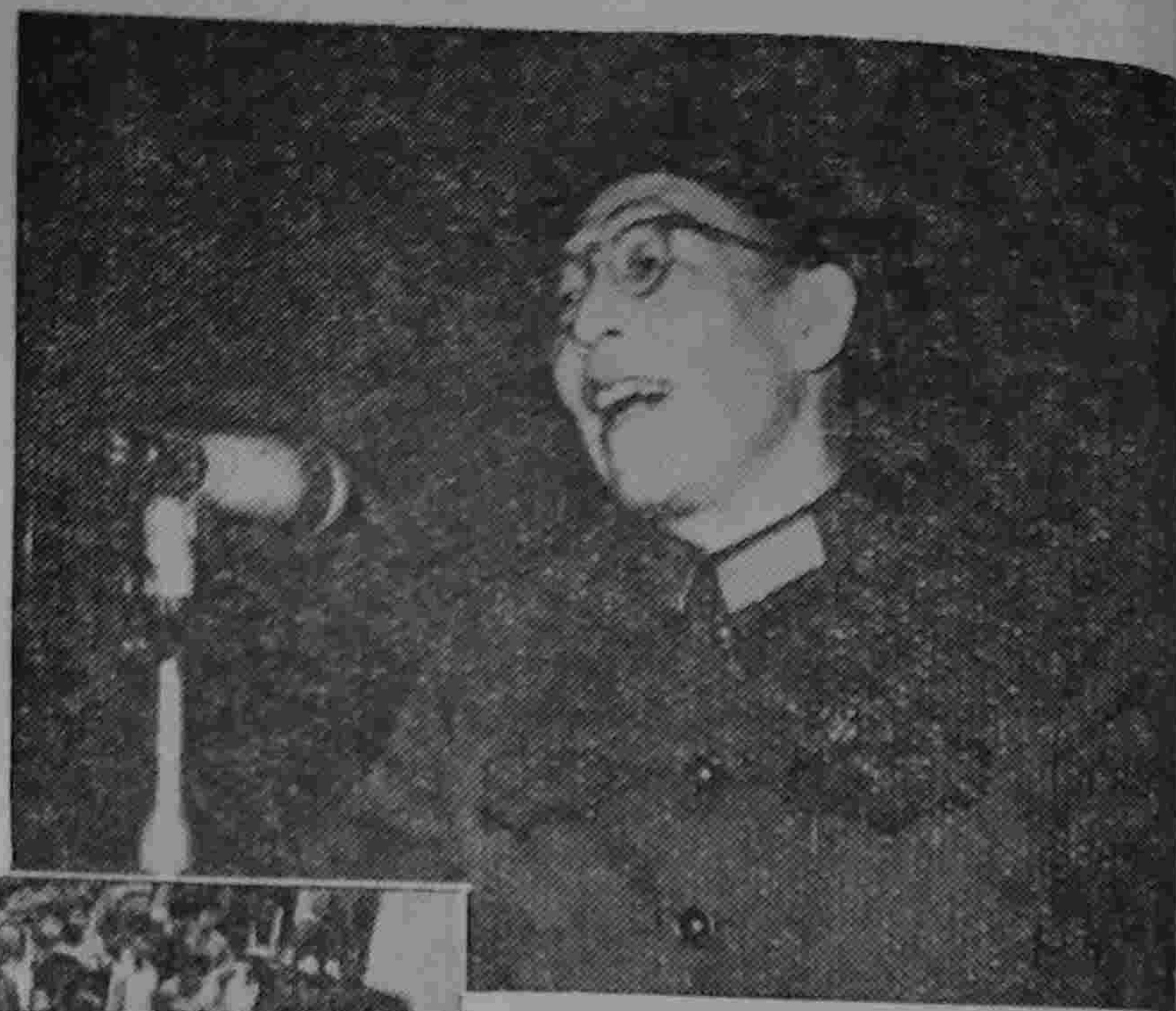
張春橋 同志在蘇州 為工總司隊 員題詞