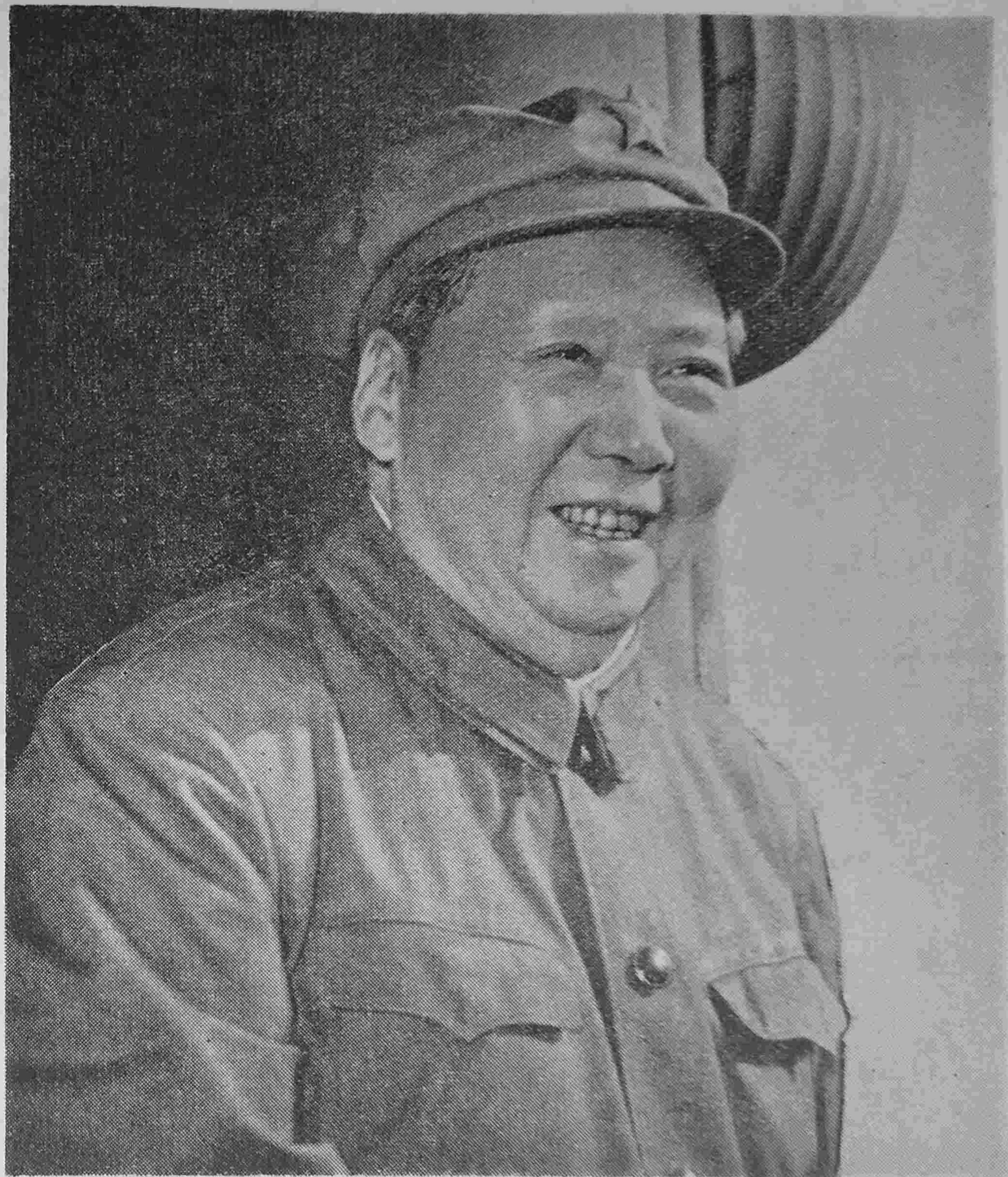
我們的偉大統帥毛主席